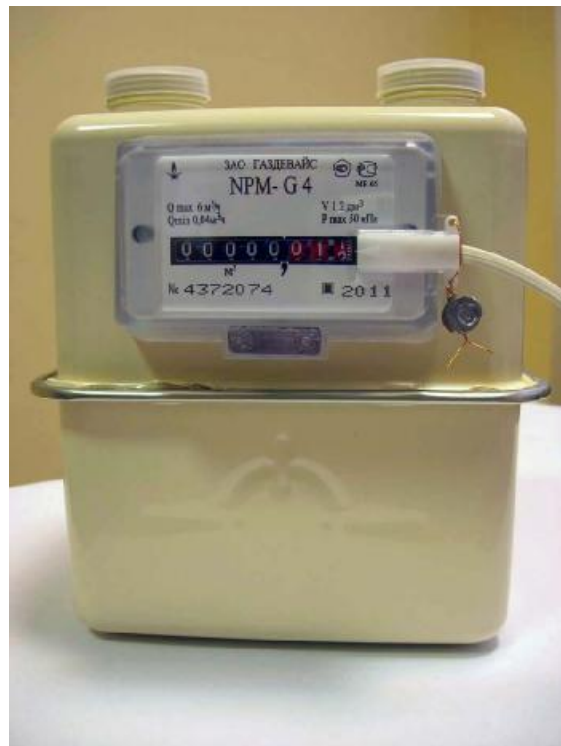
Рисунок 3 – Общий вид счетчика с датчиком импульсов