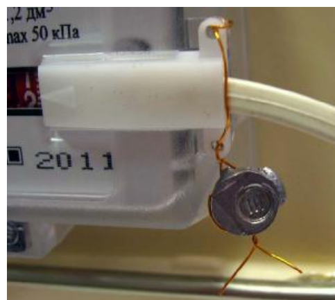
Рисунок 4 - Место пломбирования датчика импульсов