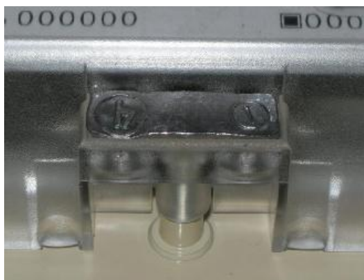
Рисунок 2 - Место пломбирования