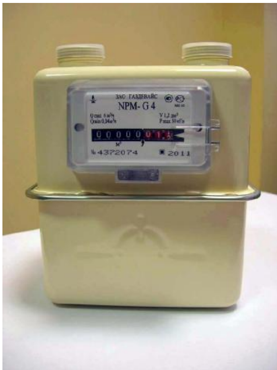
Рисунок 1 - Общий вид счетчика